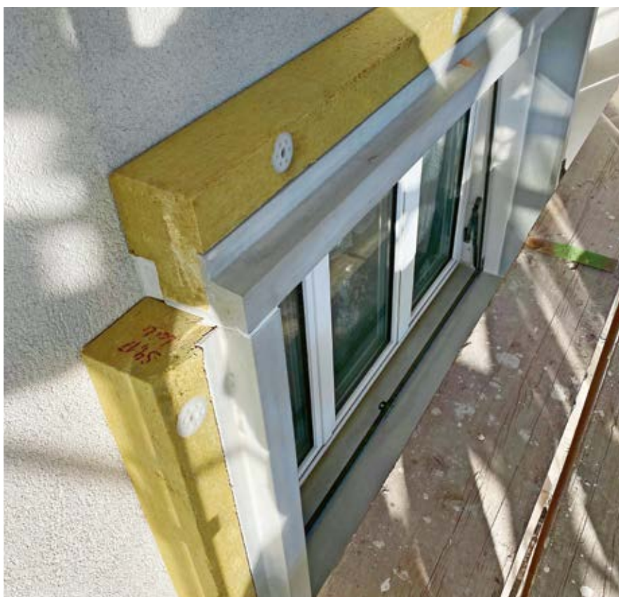
Lavoro di dettaglio per le strombature delle finestre.

Spirig: A maggio sono iniziati i lavori sul terzo palazzo. Sono molto lieto di accompagnare il progetto nella fase finale. Wehrli: Se fosse ancora richiesto il supporto della Flumroc, noi siamo sempre a disposizione!