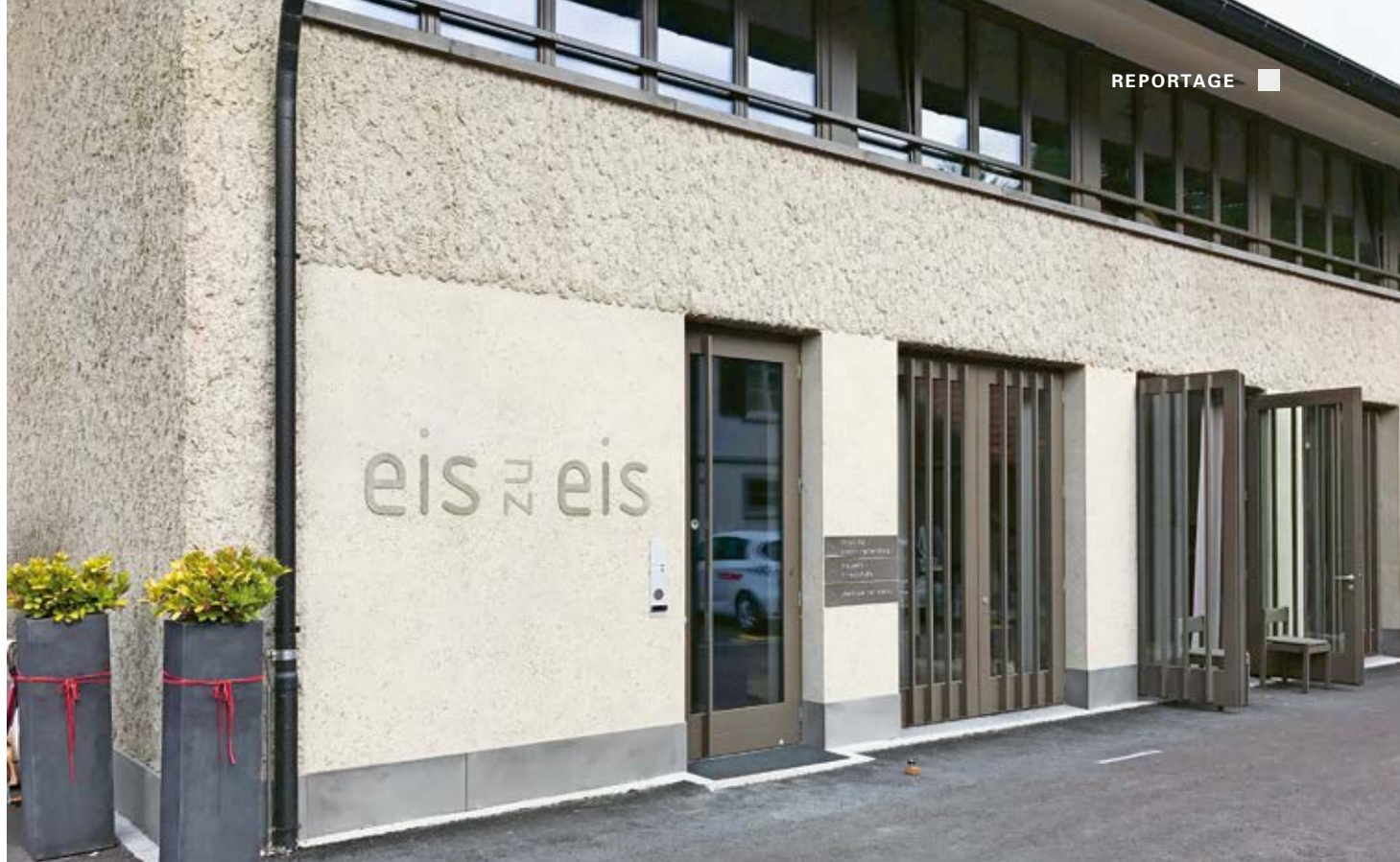
Nuovo edificio «eis z eis» della Gipsergeschäft Kradolfer GmbH di Weinfelden.