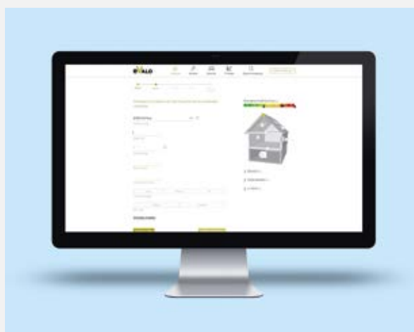
Risanamento virtuale con modelli 3D

Lo strumento online eVALO è un ausilio gratuito e di facile utilizzo pensato per i proprietari di immobili e gli imprenditori che desiderano eseguire interventi di risanamento energetico: non appena l'utente inserisce l'indirizzo dell'edificio, esso viene immediatamente visualizzato sotto forma di modello 3D sulla mappa di Google. In pochi passi eVALO calcola il consumo di energia attuale dell'edificio e indica gli interventi di risanamento che presentano il maggiore potenziale di risparmio energetico – dalla coibentazione allo sfruttamento dell'energia solare, passando per l'impianto di riscaldamento. Inoltre lo strumento indica le possibilità di finanziamento ottimali per il progetto in questione. In tal modo i proprietari di immobili possono farsene un'idea più precisa. Conoscono le opzioni disponibili e sono preparati al meglio per condurre un colloquio con architetti, addetti ai lavori o con la banca che finanzia il progetto. Il rapporto eVALO offre un supporto in più riassumendo gli interventi simulati e il loro effetto. Lo strumento è disponibile per gli imprenditori quale utile ausilio consultivo che consente di delineare in modo rapido e gratuito le opzioni disponibili.