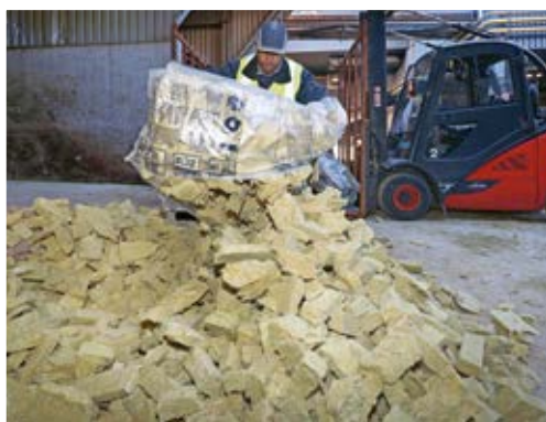
A sinistra: Flumroc ritira gli scarti dei clienti. In basso: la Flumroc AG a Flums.

Per la Flumroc è molto importante garantire consegne rapide e affidabili all'insegna del motto «Ordinato oggi, nel cantiere domani». La sede di Flums agevola all'azienda la consegna rapida in tutta la Svizzera. Perché si evitano lunghi tragitti di trasporto, code e dazi.