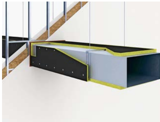
Condotti di ventilazione: isolati in modo pulito con la nuova generazione di Conlit Ductboard.